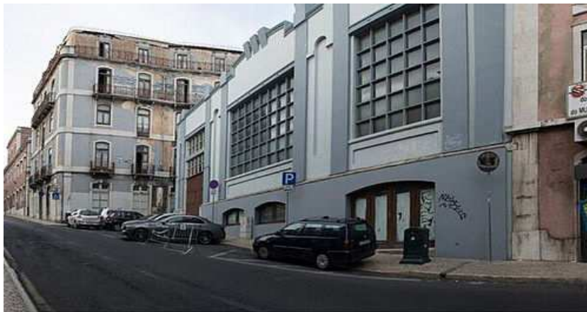
fotografias do local