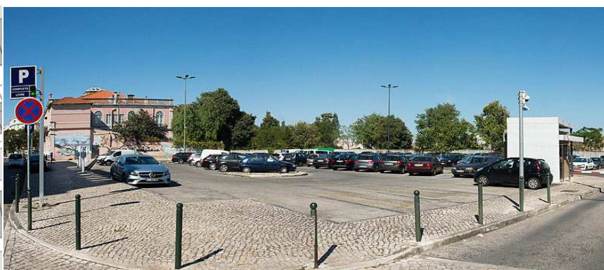
fotografias do local